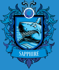
Bảng tiếng Anh English group